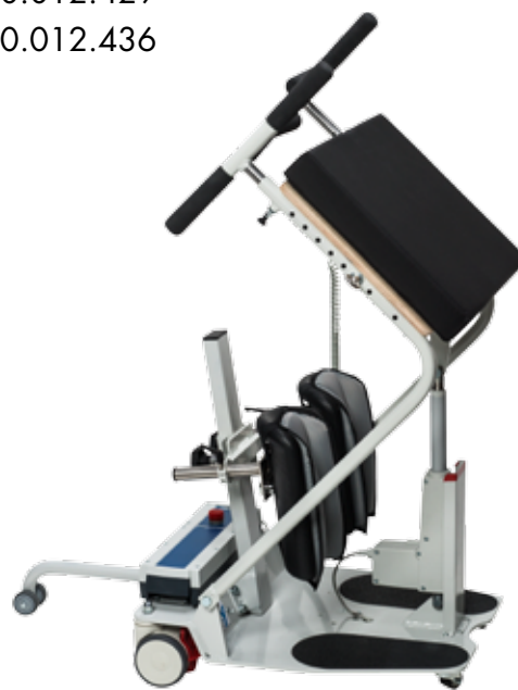
Abb. zeigt Zubehör